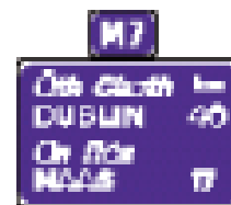
Указатель маршрута для M7