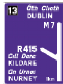
Предварительный указатель направления