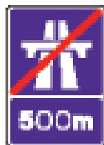
Через 500 м автомагистраль заканчивается