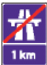
Через 1 км автомагистраль заканчивается