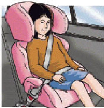
Дополнительная подушка сидения Вес: 15 - 23 кг ( 33 - 55 фунтов ) Приблизительный возраст: 4 - 6 лет