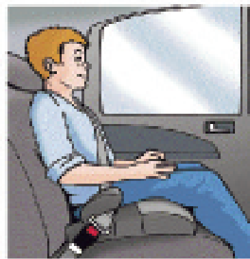
Фиксирующая подушка Вес: 22 - 36кг ( 48 - 79 фунтов ) Приблизительный возраст: 6 - 12 лет

Обеспечение надлежащей фиксации ребенка в детском сидении помогает снизить риск повреждения на 90 – 95 % для сидений, расположенных против направления движения, и на 60 % для сидений, расположенных по направлению движения *.