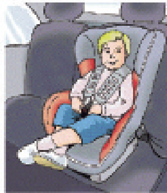
Детское сидение, расположенное по направлению движения Вес: 9 - 18 кг ( 20 - 40 фунтов ) Приблизительный возраст: 9 месяцев – 4 года