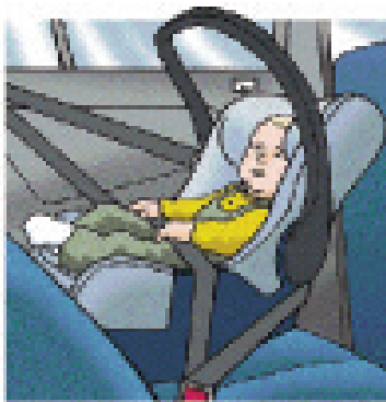
Детское сидение, расположенное против направления движения Вес: для детей весом до 13 кг ( 29 фунтов ) Приблизительный возраст: 12 - 15 месяцев

Никогда не устанавливайте сидение, расположенное против направления движения, на переднем сидении, если предусмотрена подушка безопасности для